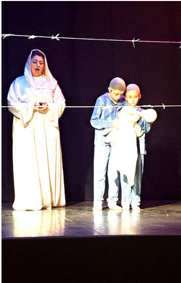
сказала начальник УКМПиС.

- Мы обязаны помнить и говорить об этом вслух, чтобы подобное никогда не повторилось, -